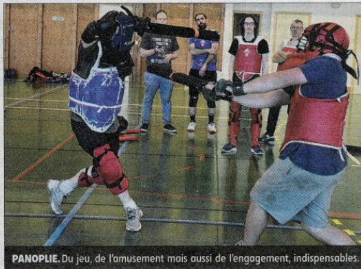
PANOPLIE. Du jeu, de l'amusement mais aussi de l'engagement, indispensables.