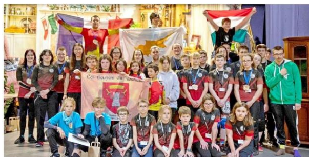
Les participants au tournoi en Pologne - © Guillaume Andrieux.

Les Écuyers du Marchidial ont récemment participé à la compétition Young Blood Tournament en Pologne, tournoi international organisé par leurs amis de Niepokorni Orzesze.