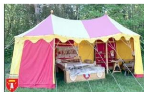
La tente médiévale.

Leur prochain rendez-vous auquel vous êtes tous conviés c'est la sixième édition de leur tournoi international de béhourd léger, les 8 et 9 juin au gymnase de Champeix.