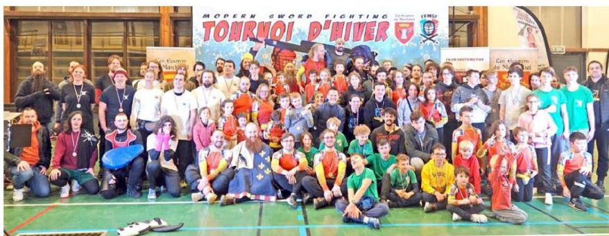
Tous les combattants, arbitres, bénévoles - © Michel Genesty.

Les retours des clubs sont très élogieux : « le plaisir de retrouver les autres clubs en compétition, le plaisir de voir les nouveaux combattants