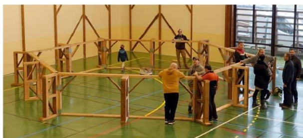
Montage de la lice - © Annick D'Hier.

Les Écuyers du Marchidial ont maintenant leur lice de béhourd.