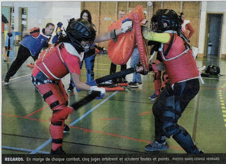
REGARDS. En marge de chaque combat, cinq juges arbitrent et scrutent fautes et points.

Le béhourd léger, qu'est-ce que c'est ? Pour lever le voile sur cette pratique, héritée de l'art du combat du Moyen Âge, mais adaptée aux moyens très contemporains, il suffit d'assister à l'un des entraînements (selon les catégories d'âge et niveaux, il y en a une dizaine par semaine),