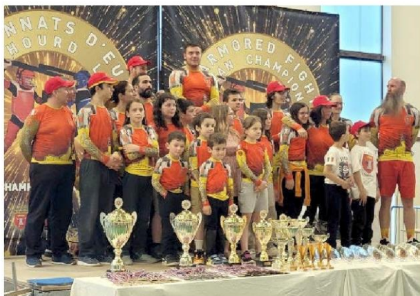
Les « Écuers » sur le podium - © « Les Écuers du Marchidial ».

Les « Écuers du Marchidial » organisaient la sixième édition des championnats d'Europe de la Safef les 8 et 9 juin au gymnase du collège. Il y avait 120 combattants pour huit pays représentés. Félicitations à tous les bénévoles de Champeix qui ont donné de leur temps pour que cet événement puisse avoir lieu : l'organisation et la communication avec les autres pays, la gestion de l'équipe arbitrale, la restauration, la création des trophées, la boutique du club, l'hébergement. Ce ne sont pas moins de 40 personnes qui ont permis ce beau week-end avec le soutien de la commune de Champeix, d'API, du Département, des communes de Courgoul, Saurier et l'association de cheerleading Anges et Démons . Au-delà des beaux combats offerts au public, saluons les très bons résultats des « Écuers » et en premier lieu les champions d'Europe 2024, auxquels les récompenses ont été remises par Roger Jean Méallet, conseiller régional, maire de Champeix, et Arlette Nugier, adjointe à la Culture. Guillaume Andrieux en conclut : « Ce fut notre plus beau et plus grand tournoi jamais organisé à ce jour ».