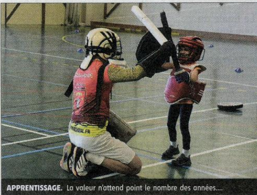
APPRENTISSAGE. La valeur n'attend point le nombre des années...

De 9 heures à 18 heures : compétition de duels. À 18 h 30 : cérémonie officielle et remise des prix de la première journée. Dimanche : de 9 heures à 15 h 30 : compétition de duels. 16 heures : remise des prix et clôture du tournoi. Entrée libre.