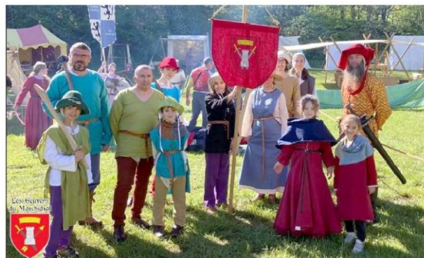
Les Écuyers en tenue médiévale - © Les « Écuyers du Marchidial ».

Les « Écuyers du Marchidial » ont réalisé leur première animation de fête médiévale de la saison à Muro, les 10 et 11 mai. Ce fut une animation plaisante et tout particulièrement réussie : superbe prestation des jeunes du club sur le campement, superbe ambiance dans le groupe des adultes, toujours un public en masse à l'ini-