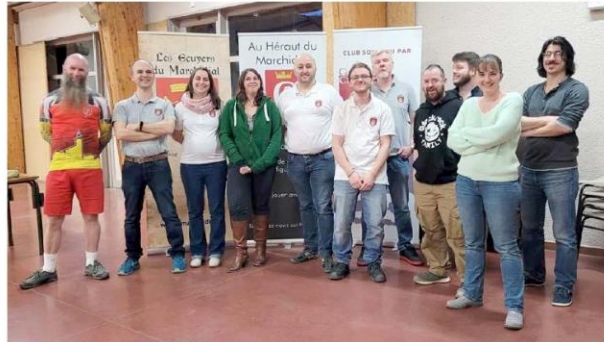
L'équipe d'animation satisfaite de cette journée - © association « Au Héraut du Marchidial ».

L'association Au Héraut du Marchidial organisait, samedi dernier, sa 12 e fête du jeu. Ce