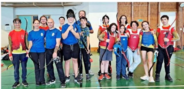
Les deux équipes réunies - © Guillaume Andrieux.

Les 21 et 22 octobre, Les Écuyers du Marchidial recevaient Les Amis du château de Châteaudun à l'occasion d'une compétition sportive de Battle Arc, le tournoi « La Flèche Automnale ». Après un entraînement collectif, afin de se donner quelques ficelles et se mettre d'accord sur les règles de ce sport naissant, la compétition a pu commencer.