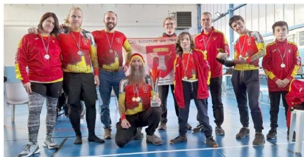
L'équipe aux Joutes phocéennes.

Les Joutes phocéennes étaient aussi une première, rassemblant cinq clubs de la moitié sud de la France. Côté Écuyers, sur les neuf combattants, huit reviennent avec au moins une médaille. Ce très bon résultat permet au club champillaud de remporter le trophée de la première place au classement des clubs, devant les organisateurs, l'école d'escrime médiévale « L'Âme Impétueuse » (Marseille) et « Les Guerriers du Lendemain » (Marseille).